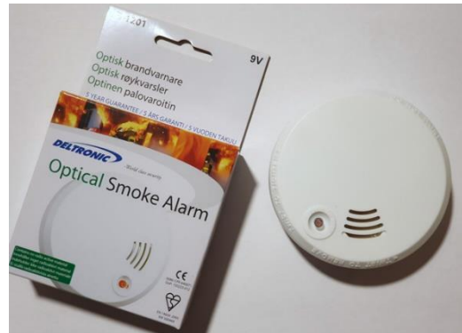
Brandvarnare av den typ som delats ut av föreningen